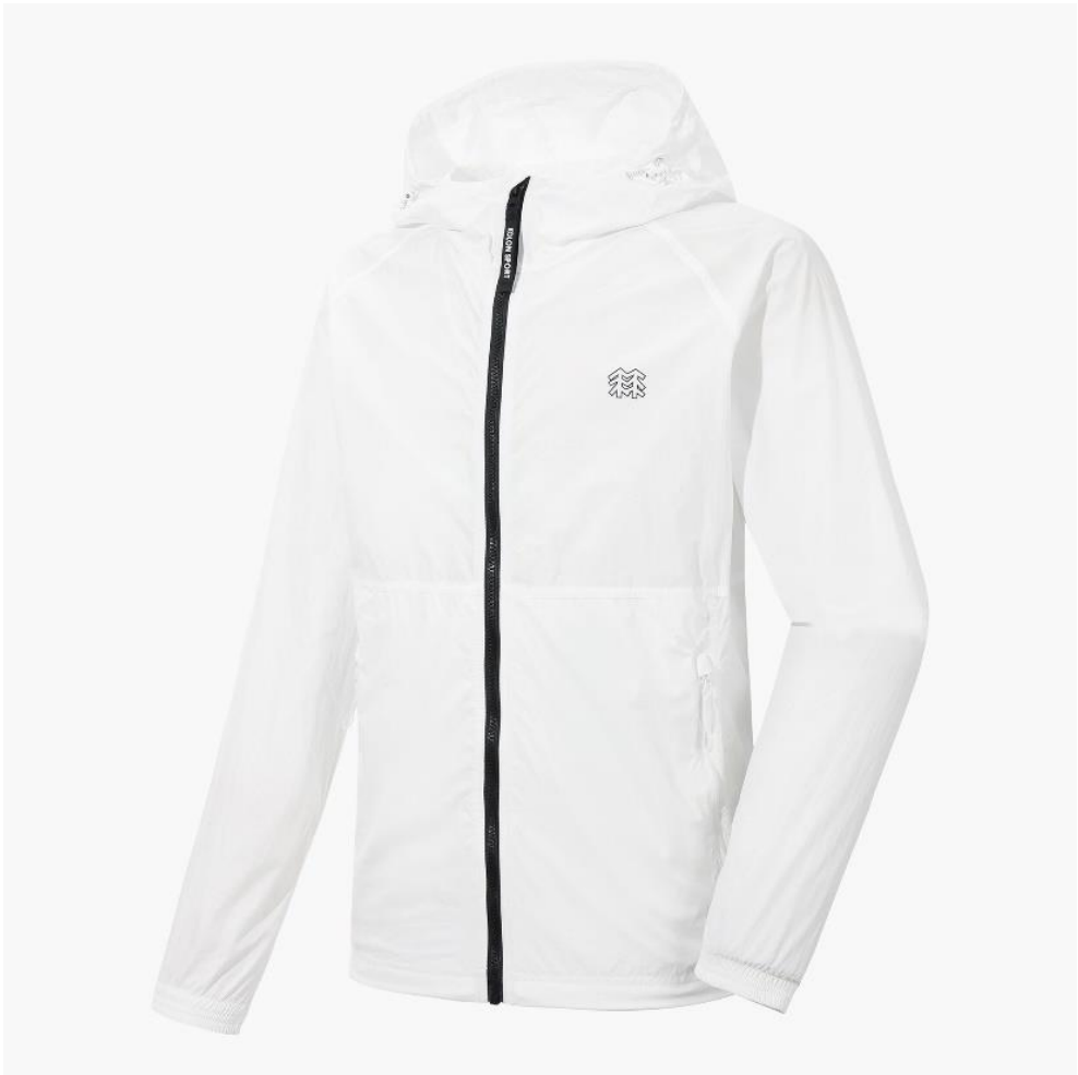
코오롱스포츠 바람막이 사이즈 조건표