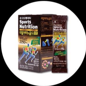
[코오롱제약] 리얼아미노골드, 패스트리커버